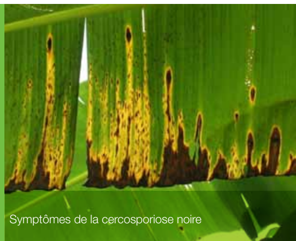
Symptômes de la cercosporiose noire

De plus, les recommandations d'utilisation ont été approuvées en mars 2010 par le groupe de travail international du FRAC (Fongicide Resistance Action Committee), démontrant que le produit Syllit est reconnu par la communauté internationale.